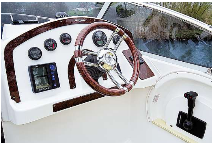
Übersichtlicher Steuerstand mit höhenverstellbarem Lenkrad

optional erhältlichen zweiten Kühlschrank. Wie erwähnt, führt der Weg aufs Vorschiff nicht klassisch über Gangborde, vielmehr hat man in die GFK-Form drei Tritte eingefügt, durch die sich diese Aufgabe leicht und sicher aus dem Cockpit he-