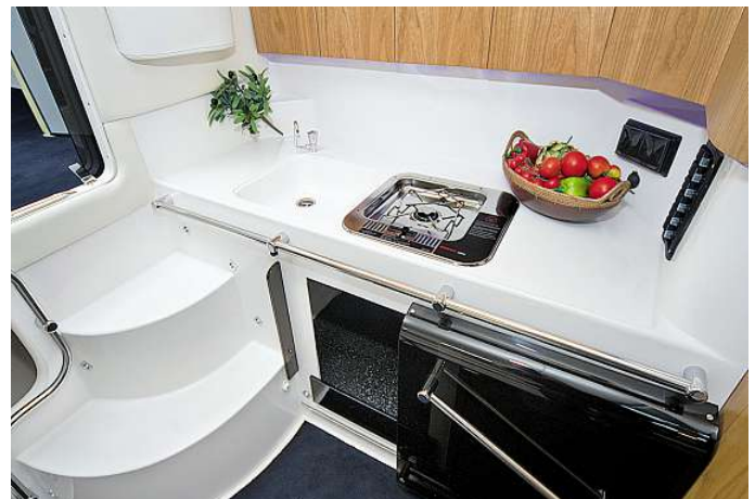
Die piffige Kunststoff-Schiebetür spart wertvollen Platz im Salon