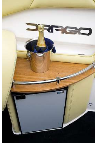
Die Ablage ist Standard, der Kühlschrank kostet Aufpreis