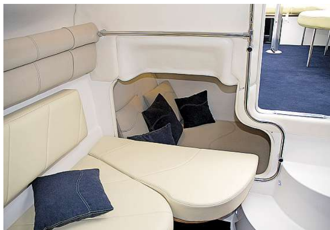
Das Sofa im Salon kann mit einem Polsterteil erweitert werden

Beschleunigt man die Drago, neigt sie in Verdrängerfahrt leicht zum Gieren, was angesichts des schlanken Rumpfes als normal anzusehen ist. Diese bauartbedingte „Unart“ verliert sich jedoch mit zunehmender Geschwindigkeit. Gleitfahrt stellt sich im Drehzahlbereich um 3000 min -1 ein, dann nähert man sich mit 19,9 kn dem Ziel. Die am Fahrstand gemessenen 72 dB(A) stellen einen sehr guten Wert dar. Unter Volllast erreicht die Drago eine Höchstfahrt von 32,2 kn. Dies, und die dabei am Fahrstand ermittelten 80 dB(A), stellen für diese Bootskategorie einen sehr guten Wert dar. Für das Umsteuern von hart Back- auf hart Steuerbord benötigt es nur zweieinhalb Umdrehungen des Steuerrades. Der Drehkreis in Verdrängerfahrt beträgt etwas mehr als eine Bootslänge über jeden Bug.