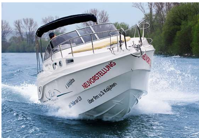
Der schlanke Rumpf erreicht eine Höchstfahrt von mehr als 32 kn

Serienmäßig wird die Drago 29 Olymp mit einem Volvo Penta 4.3 GL/DP ausgeliefert. Unser Testboot wird von einem Volvo Penta D3-220 DP angetrieben. Der Reihenfünfzylinder-Turbodiesel mit Common-Raileinspritzung generiert aus 2400 cm 3 Hubraum eine Leistung von 162 kW (220 PS) bei einer Nenndrehzahl von 3500 min -1 . Damit ist die trocken rund 2700 kg wiegende Drago sehr gut unterwegs. Mit 1000 min -1 schiebt der Turbodiesel das Kajütboot mit gerade noch hafenzulässigen 4,8 kn auf Kurs. Dank der zum Motorpaket gehörenden Servolenkung lassen sich die Manöver spielend leicht absolvieren. Aufgrund der hohen, windanfälligen Konstruktion ist das optional verfügbare Bugstrahlruder eine gute Wahl.