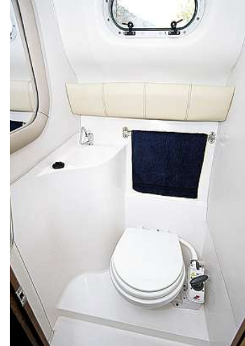
Heller, pflegeleichter Sanitärtrakt mit Pump-WC

Beschleunigt man die Drago, neigt sie in Verdrängerfahrt leicht zum Gieren, was angesichts des schlanken Rumpfes als normal anzusehen ist. Diese bauartbedingte „Unart“ verliert sich jedoch mit zunehmender Geschwindigkeit. Gleitfahrt stellt sich im Drehzahlbereich um 3000 min -1 ein, dann nähert man sich mit 19,9 kn dem Ziel. Die am Fahrstand gemessenen 72 dB(A) stellen einen sehr guten Wert dar. Unter Volllast erreicht die Drago eine Höchstfahrt von 32,2 kn. Dies, und die dabei am Fahrstand ermittelten 80 dB(A), stellen für diese Bootskategorie einen sehr guten Wert dar. Für das Umsteuern von hart Back- auf hart Steuerbord benötigt es nur zweieinhalb Umdrehungen des Steuerrades. Der Drehkreis in Verdrängerfahrt beträgt etwas mehr als eine Bootslänge über jeden Bug.