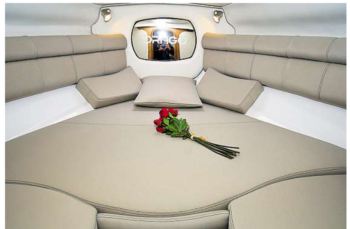
Die große Doppelkoje in der hellen und freundlichen Eignerkabine